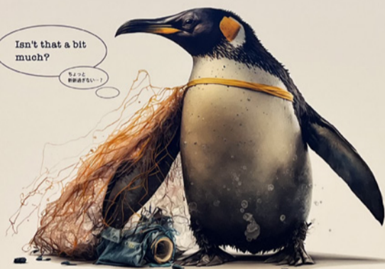
なくそう! 海洋ゴミ