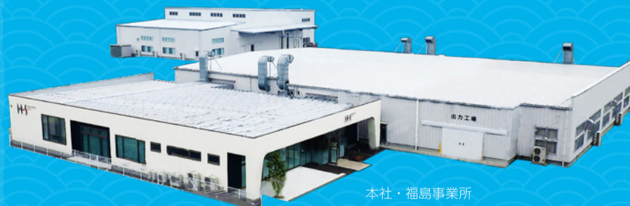
本社・福島事業所