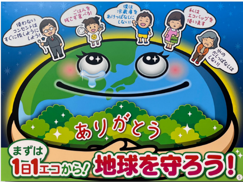
第5位 サインクリエイター協会賞 秋田県 (有)ビッグアート 煤賀 繁広氏