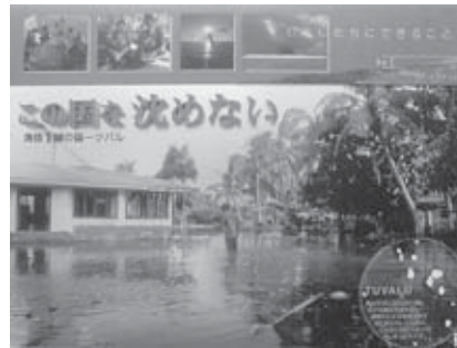
日広連賞 「海面上昇の予先(環境)」 青森県 株式会社アイサイン