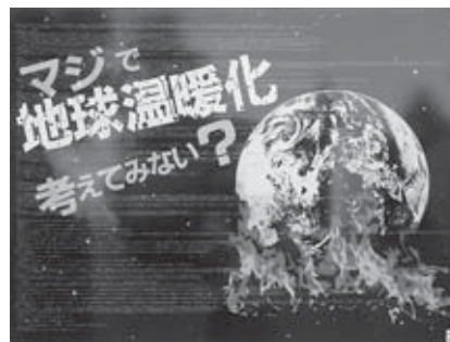
奨励賞 「地球温暖化について(環境)」 青森県 サイトウ看板店