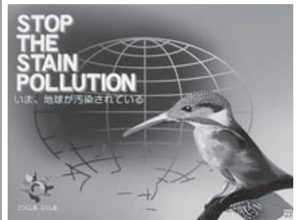
奨励賞 「うつくしま、ふくしま。(環境)」 福島県 旬アーム工芸