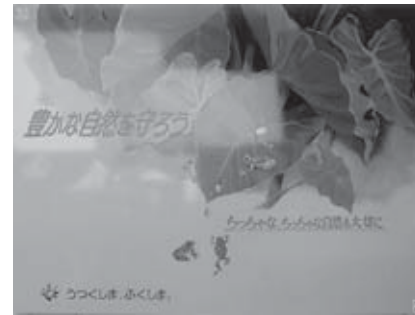
東北地区連会長賞 「うつくしま、ふくしま。(環境)」 福島県 二海堂看板店