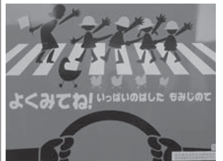
奨励賞 「よくみてね! いっぱいのぼした もみじのて」 岩手県 旬長沢画房