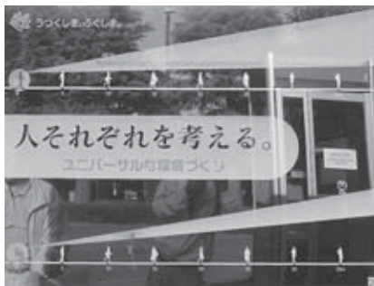
優秀賞 「うつくしま、ふくしま。(環境)」 福島県 株式会社アルス・プログレス