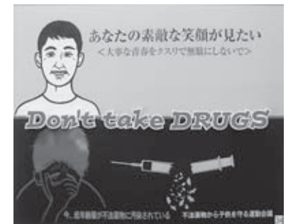
奨励賞 「麻薬防止」 青森県 アート工芸