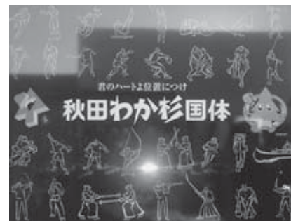
奨励賞 「国体」 秋田県 株式会社アド秋田