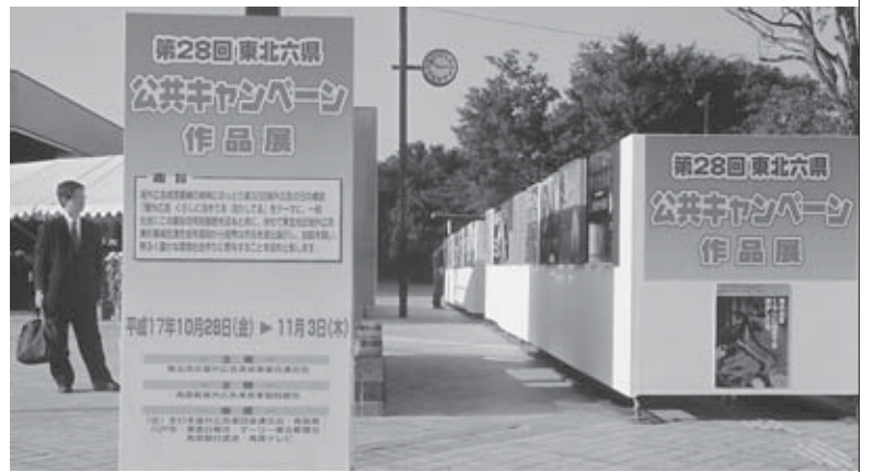
〈八戸市庁舎前広場の展示風景〉