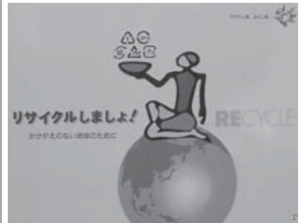
優秀賞 「うつくしま、ふくしま。(環境)」 福島県 有フジイ広告社