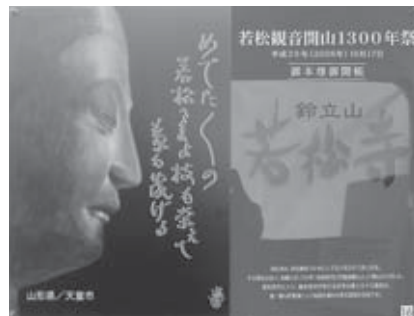
優秀賞 「若松観音 開山1300年祭」 山形県 旬天童アド工芸