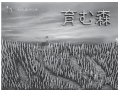
国土交通大臣賞 「うつくしま、ふくしま。(環境)」 福島県 阿企デザイン社